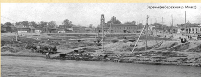
Зереchny (Забережnyy) р. Маясск