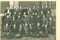
Выпуск 22.05.26 г.