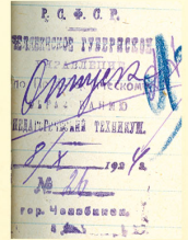
Фрагмент банка техникума, 1928 г.