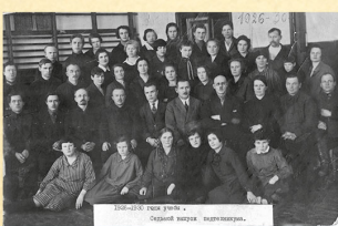
Выпуск 22.05.26 г.