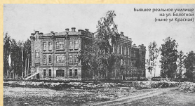
Бывшее реальное училище на ул. Большой (ныне ул. Красная)