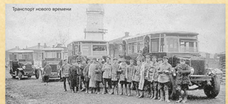
Новоселение в Рязаново