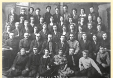
5-й выпуск, 1928 г.